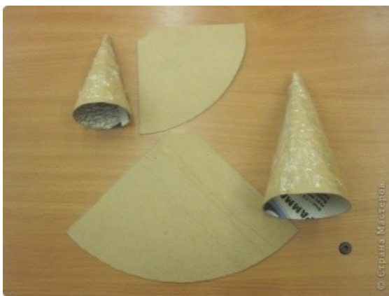
1. Сделать конус из картона.