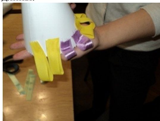
4. Наклеить ее на основание конуса.