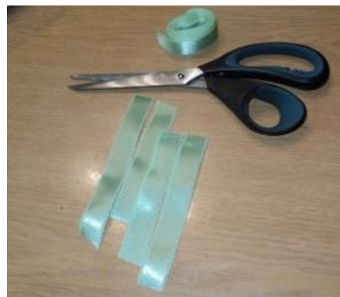
2. Нарезать ленточки определенной длины.