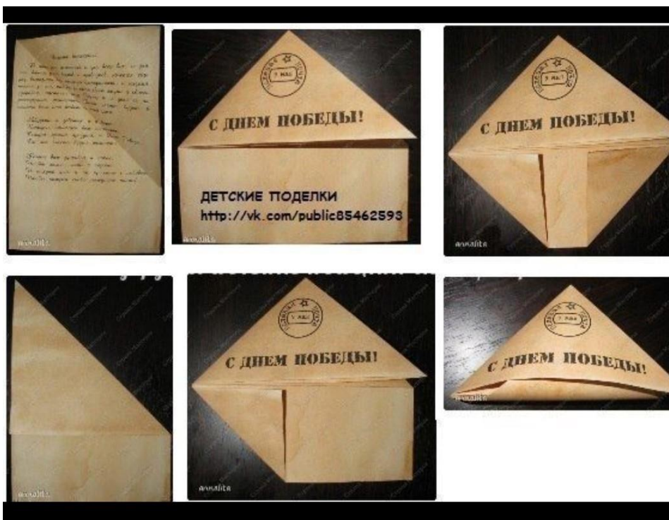
Схема «Фронтное письмо»