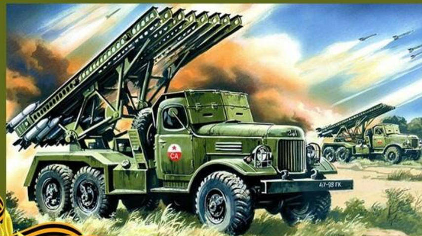
«Катюша» —оружие победы советского народа