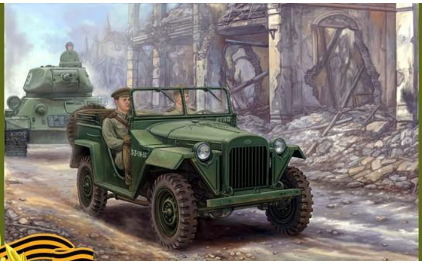
ГАЗ-67. Машина для войны и мира