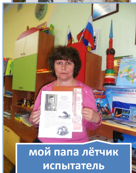
мой папа лётчик испытатель