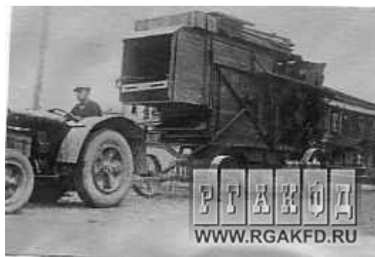
Фото 1. Доставка сложной молотилки в Лотошинскую МТС со станции Волоколамская (1935 г.)