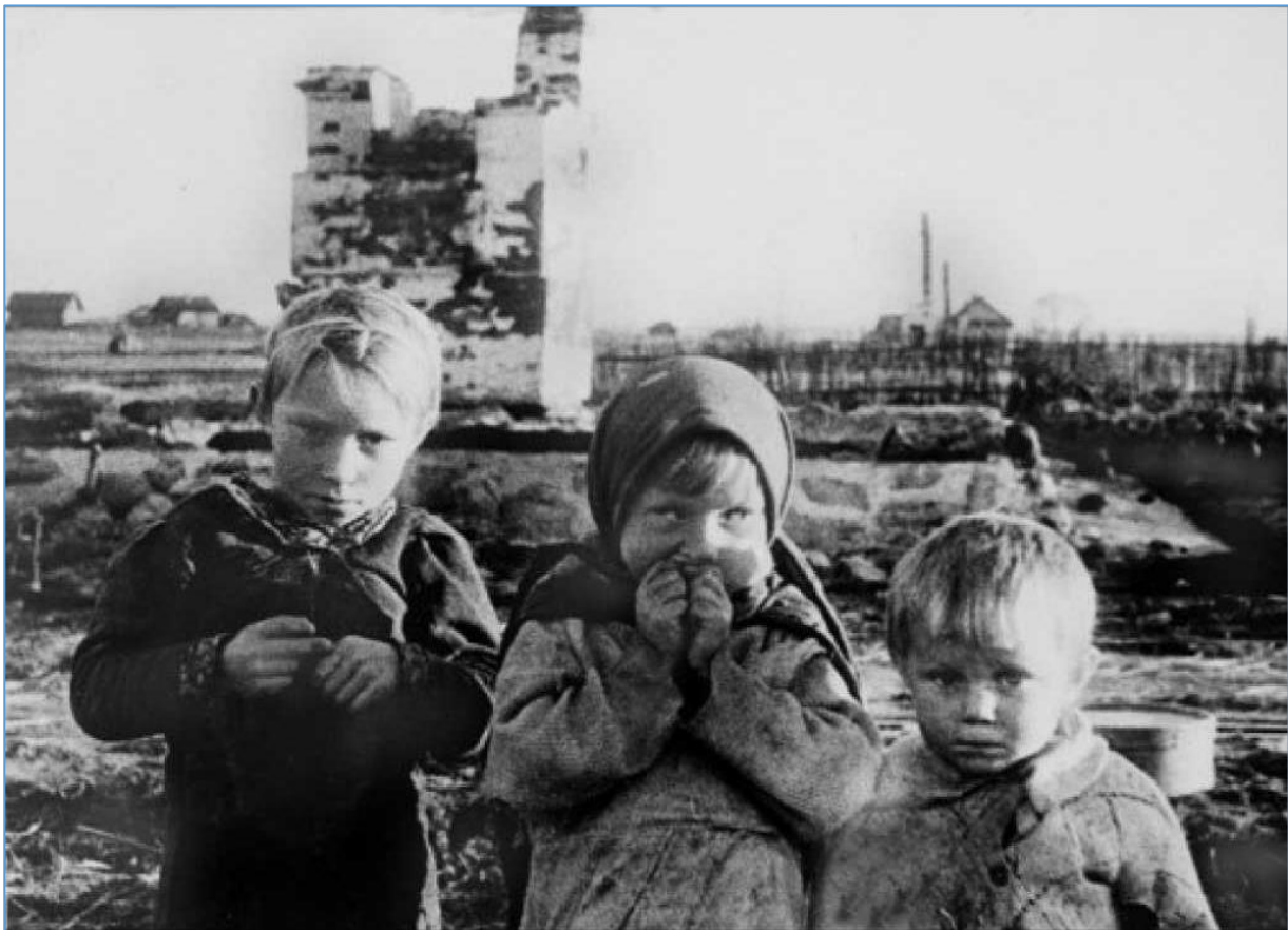
Дети у разрушенного дома