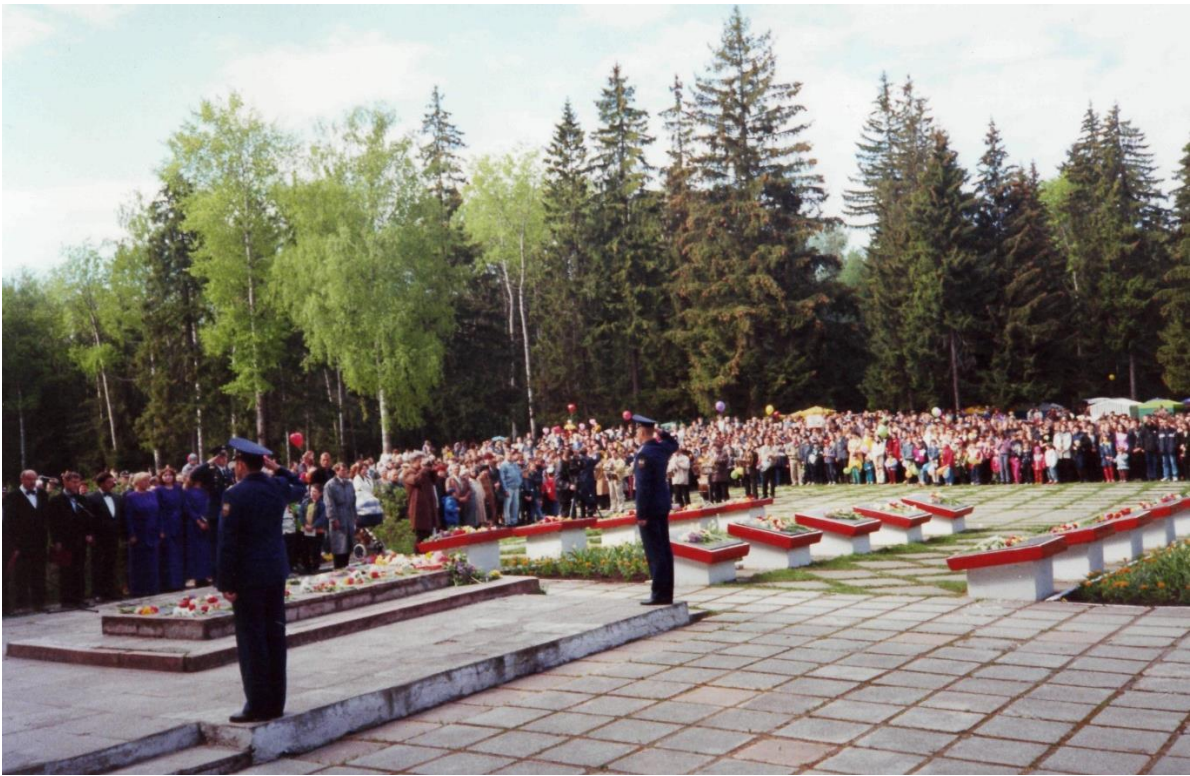
Вид Мемориального комплекса до 2005 г.